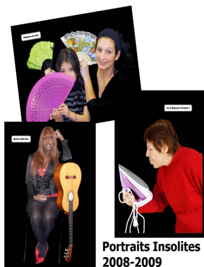
Portraits Insolites 2008-2009

FORUMS : visionnement et critique des images Sortie Prises de vue à la journée Séances de Prises de vue en Studio Ateliers débutants (en septembre)