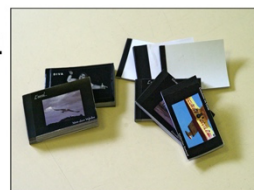
Réalisation de Livres animés 2011-2012