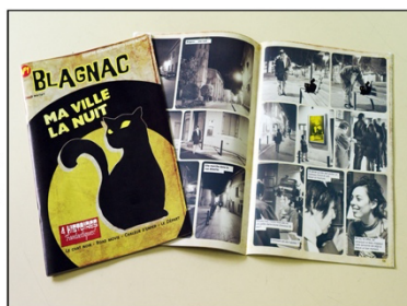
Making Off du court-métrage «Clarisse» 2010-2011