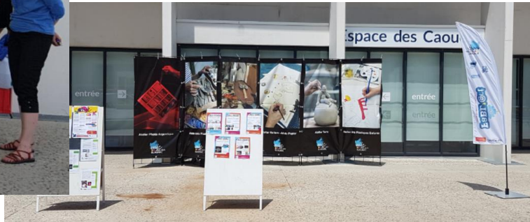
Expo des photos prises au Marché aux fleurs