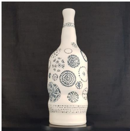
Pratique libre Terre Voyage de la bouteille pendant le confinement