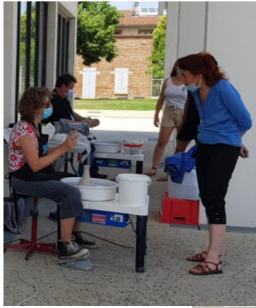
RDV nomade en juin